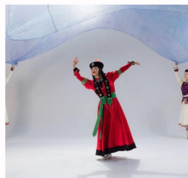
Performance d'artistes de Mongolie intérieure (Chine) réalisant le Biyelgee (danse aussi pratiquée par le Khovd et d'Uvs de Mongolie)