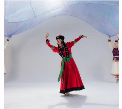
Performance d'artistes de Mongolie intérieure (Chine) réalisant le Biyelgee (danse aussi pratiquée par le Khovd et d'Uvs de Mongolie)